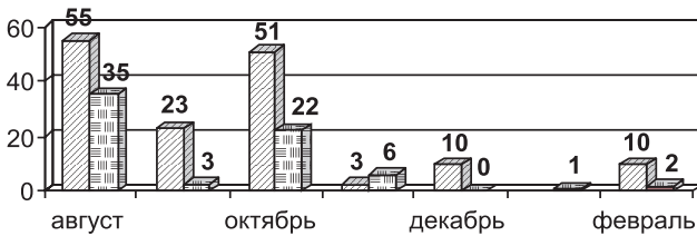
Рис. 1. Динамика арестов духовенства в августе 1937 – феврале 1938 года:

Анализ динамики производимых арестов отчетливо показывает (рис. 1) чередование подъемов и спадов активности при общем уменьшении ее амплитуды: за августовским пиком следует сентябрьский спад, и новый пик в октябре, не достигающий размера августовского. Затем новый спад в ноябре и далее – затухание интенсивности арестов в январе-феврале 1938 года.